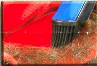
entfernt Tierhaare überall