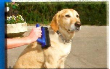
für Hunde und Katzen