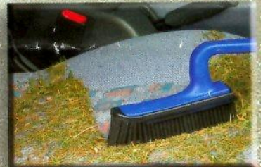
super auch im Auto