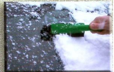
fegt Schnee vom Auto