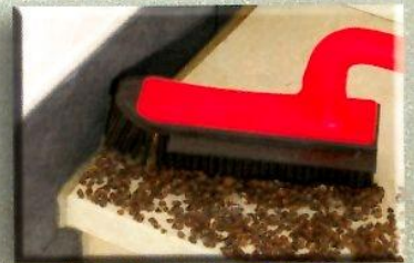
sauber bis in die Ecken