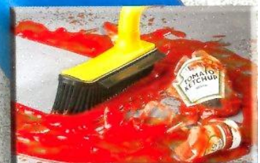
praktisch im Haushalt